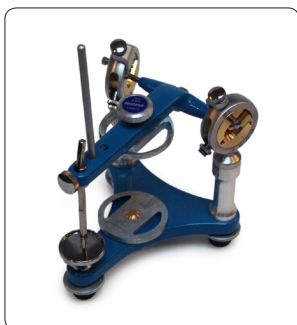
Dentatus Disques vissés