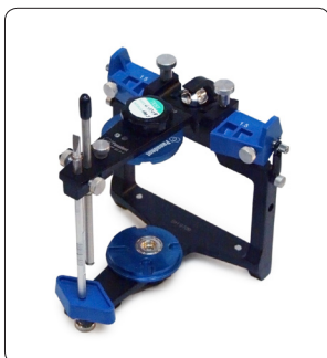
Panadent Disques magnétiques