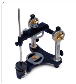
Hanau Disques vissés