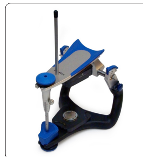
Artex Disques magnétiques