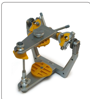
Sam 3 Disques magnétiques ou vissés