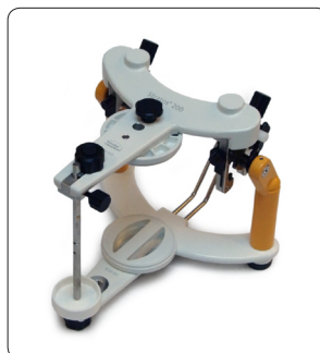
Stratus 200 Disques magnétiques ou vissés