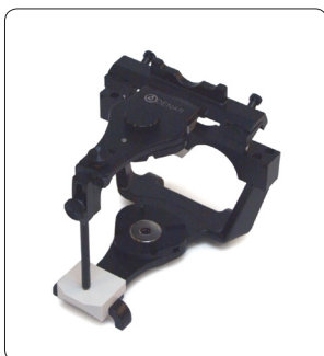
Denar Disques magnétiques ou vissés